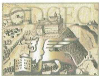
Circondario Tribunale di Cassino